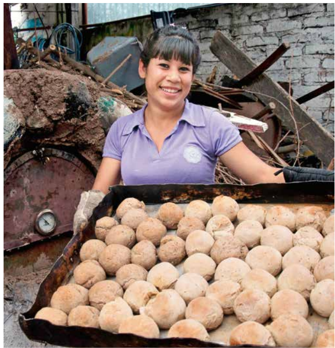
Brot wird auf dem ganzen Erdball in unterschiedlicher Form gebacken. In Guatemala (links), Bangladesch (Mitte) und Argentinien (rechts). Das Symbol Brot vereint Menschen auf der Erde miteinander.

ALTERNATIV KÖNNEN SIE AUCH ZU EINEM REFORMATIONSFRIHSTÜCK MIT REFORMATIONSBROTCHEN UND FAIR GEHANDELTEM KAFFEE UND TEE EINLADEN UND ÜBER DIE ARBEIT VON BROTFÜR DIE WELT INFORMIEREN.