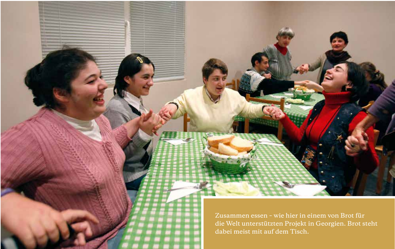
Zusammen essen - wie hier in einem von Brot für die Welt unterstützten Projekt in Georgien. Brot steht dabei meist mit auf dem Tisch.